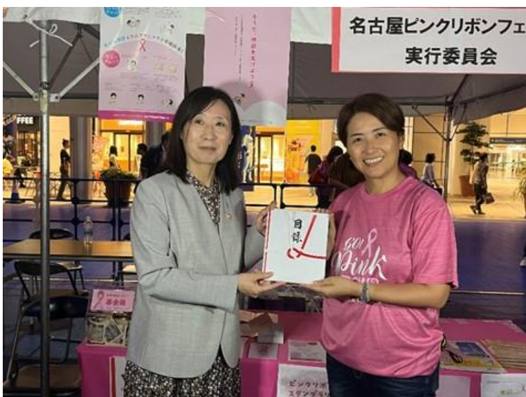
【寄贈先】 一般社団法人 名古屋ピンクリボンフェスタ実行委員会 様