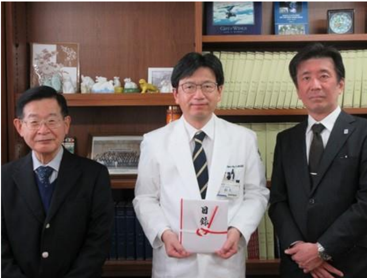
【寄贈先】 三重大学大学院 医学系研究科 臨床医学系講座 脳神経外科学 様